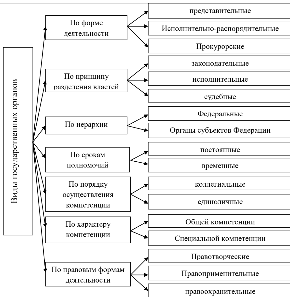
Рисунок 3 - Виды государственных органов (составлено автором)

Как отмечалось ранее, эффективность государственного управления напрямую влияет на все сферы развития страны. Так как в данном исследовании мы акцентируем внимание на экономической безопасности страны, нами видится необходимость применения в целях повышения защитных свойств национальной экономики инновационных методов информационной экономики. В связи с этим целесообразным, по мнению авторов, разработка и реализация принципов данного механизма органами государственного управления.