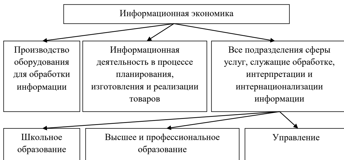
Рисунок 4 - Элементы информационной экономики

Так, информационная экономика представляет собой определенные критерии постиндустриального общества [19,20], т.е. науку, которая исследует хозяйственную деятельность, предусматривающая широкое повсеместное внедрение и использование информационно-коммуникационных технологий в процессах общественного производства, распределения и потребления общественных благ. Также информационную экономику можно представить как хозяйство, в котором производство, обработка, распределение и потребление информационных потоков являются доминирующими факторами в сравнении с производством материальных благ (Рисунок 4).