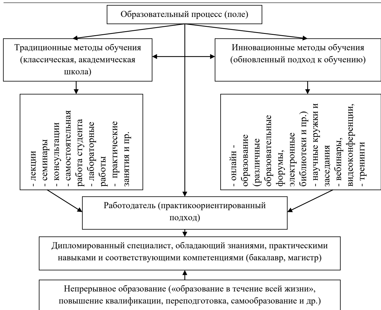
Рис 2. Модель формирования процесса обучения квалифицированного социального работника в рамках непрерывного образования

В заключение отметим, что организация образовательного процесса непрерывной профессиональной подготовки будущих социальных работников должна осуществляться на принципах студентоориентированного обучения [19-20]. Образовательный процесс в рамках такого подхода осуществляется в следующих формах: