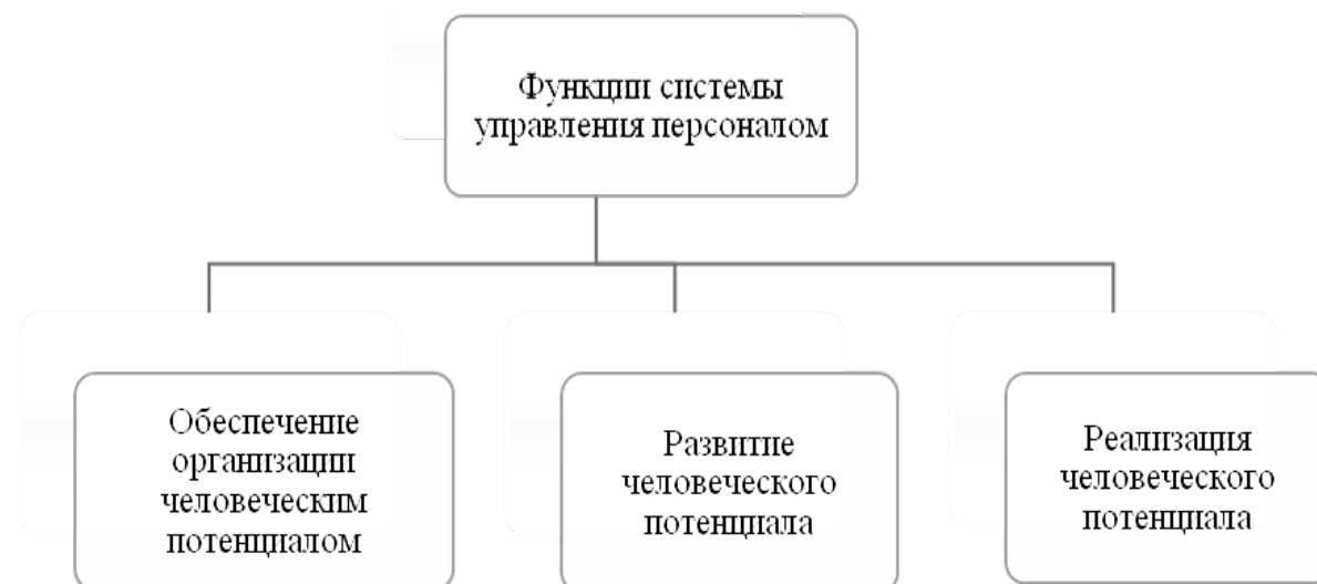
Рис. 2. Группировка функций системы управления персоналом [9]

Лесной комплекс РФ состоит из двух основных хозяйственных сфер: лесного хозяйства и лесной промышленности.