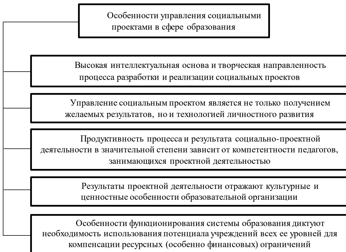
Рис. 1. Особенности управления социальными проектами в сфере образования

значению. Основные особенности управления социальными проектами в социальной сфере, отражающие специфику становления социального проектирования в современном образовательном пространстве, представлены на рис. 1.