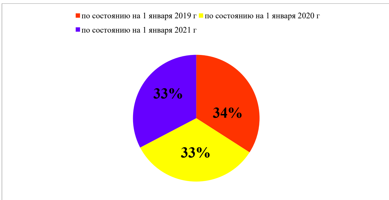
Рис. 2. Процентное соотношение снижения остатка неоконченных исполнительных производств о взыскании алиментов (в тыс. дел)*