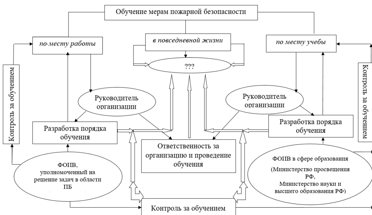
Рис. 3. Организация обучения населения Российской Федерации мерам пожарной безопасности (составлено авторами)

В Российской Федерации за организацию и проведение обучения мерам пожарной безопасности лиц, осуществляющих трудовую или служебную деятельность в организациях, и за обязательное обучение обучающихся в образовательных организациях несут ответственность руководители соответствующих организаций и образовательных организаций (ст. 38, 39 ФЗ № 69-ФЗ), и проведение такого обучения контролируется государством в лице Федерального государственного пожарного надзора МЧС России (рис. 3).