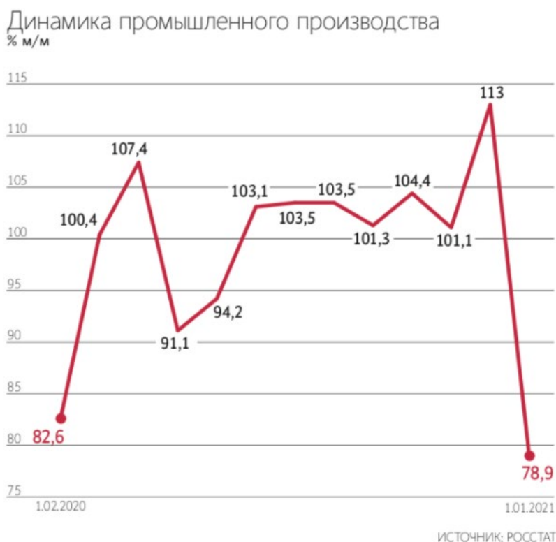
Рис. 2. Динамика промышленного производства

Неопределенность экономической ситуации, высокий уровень налогов, недостаточный спрос на товары и услуги на внутреннем рынке отразились на снижении индекса предпринимательской уверенности.